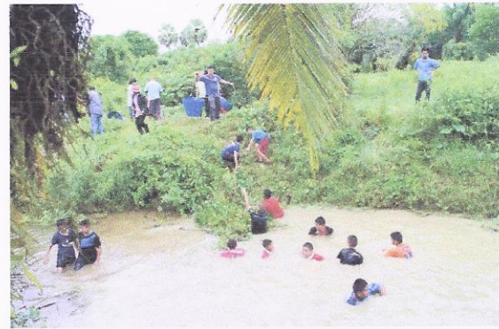
โครงการอนุรักษ์และพัฒนาแม่น้ำ คูคลองแห่งชาติ