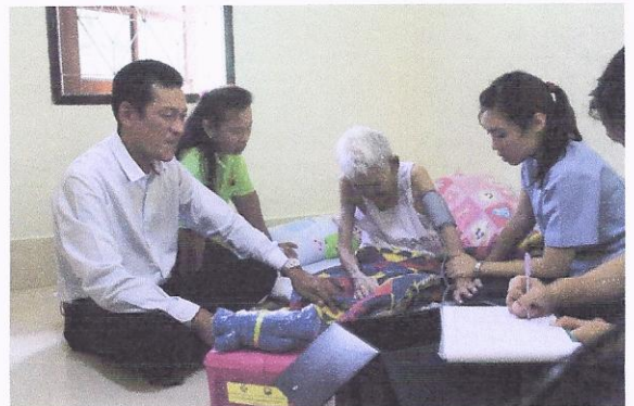
โครงการอบรมให้ความรู้การฟื้นฟูสมรรถภาพคนพิการ ตรวจสอบสุขภาพคนพิการ และเยี่ยมบ้านคนพิการ ผู้สูงอายุที่ช่วยเหลือตัวเองไม่ได้