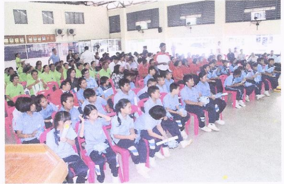
โครงการป้องกัน และควบคุมโรคเลือดออกในชุมชน เขตเทศบาลตำบลวังไผ่