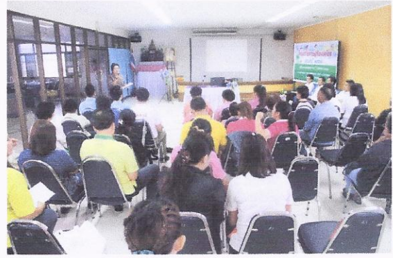
โครงการเศรษฐกิจพอเพียง