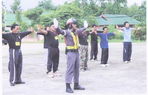
โครงการฝึกอบรมอาสาสมัครป้องกันภัยฝ่ายพลเรือน(รุ่นที่๔)