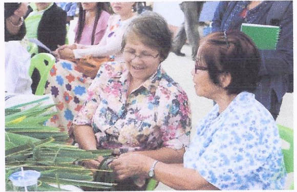
กิจกรรมต่างรุ่นต่างวัยหัวใจเดียวกัน