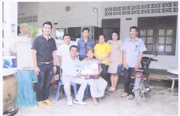
กิจกรรมมอบเงินสงเคราะห์แก่ผู้ประสบปัญหาทางสังคม