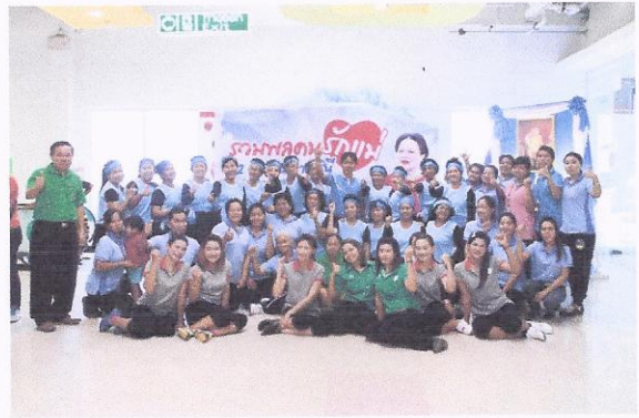
โครงการรวมพลคนรักแอรอบิกเทิดพระเกียรติ ๑๒ สิงหาคมราชินี