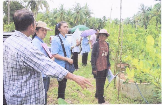
โครงการพัฒนาและส่งเสริมอาชีพ