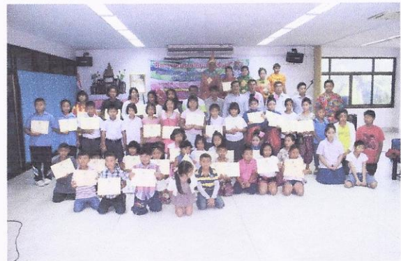
โครงการจัดกิจกรรมค่ายเยาวชน