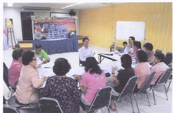
โครงการส่งเสริมสนับสนุนการเรียนรู้ด้านภาษาและวัฒนธรรมของประเทศในประชาคมอาเซียนและที่เกี่ยวข้องให้แก่เด็ก เยาวชน และประชาชนเพื่อเตรียมความพร้อมเข้าสู่ประชาคมอาเซียน