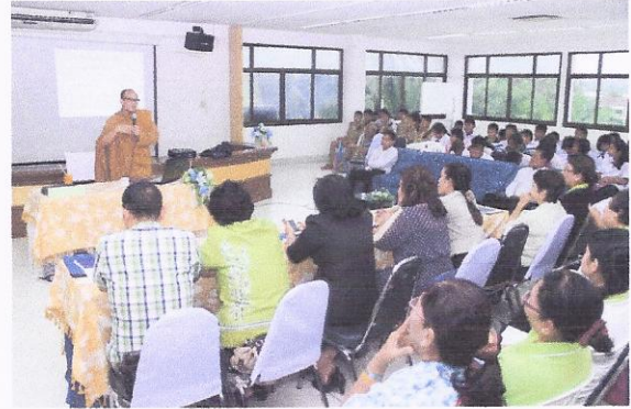
โครงการอบรมให้ความรู้เกี่ยวกับประชาธิปไตยและการมีส่วนร่วมของประชาชน