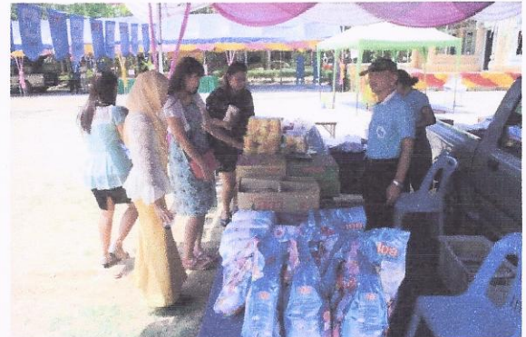
โครงการลานค้าชุมชน