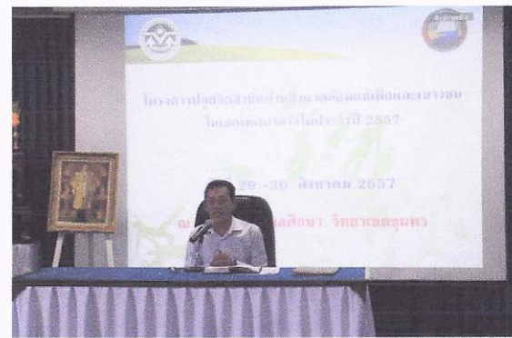
โครงการปลูกจิตสำนึกด้านสิ่งแวดล้อมแก่เด็ก เยาวชนในเขตเทศบาลตำบลวังไผ่