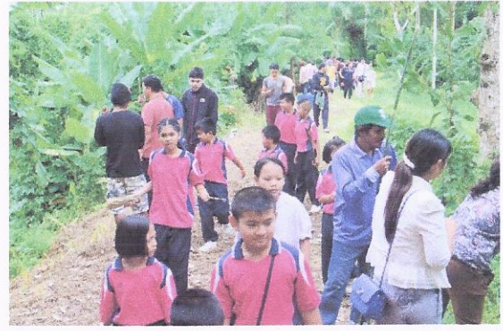
โครงการปลูกหญ้าแฝกและบำรุงรักษา